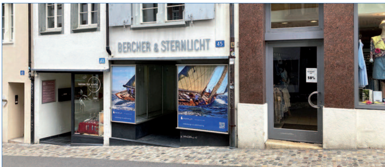
DropNet AG am Spalenberg 45 in Basel

Nach über 20 Jahre verlässt DropNet AG das Büro in Münchenstein und zieht um in die Weltstadt Basel.