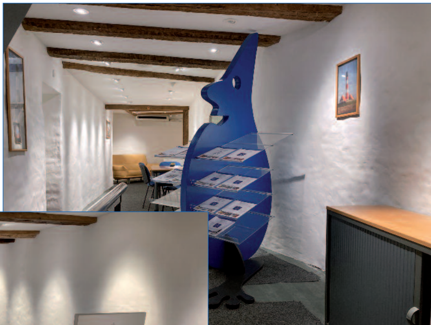
Selbstverständlich muss der Tropf mit

Mit den neuen Räumlichkeiten wünscht sich DropNet AG eine enge Zusammenarbeit mit allen Beteiligten im Haus. ■