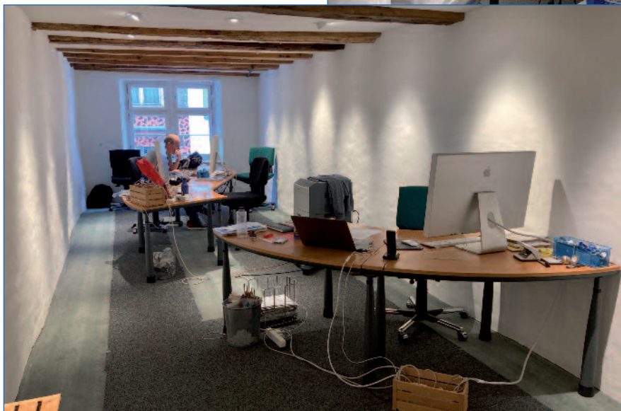
Das neue Büro der DropNet AG seit Juli 2021

Mit den neuen Räumlichkeiten wünscht sich DropNet AG eine enge Zusammenarbeit mit allen Beteiligten im Haus. ■