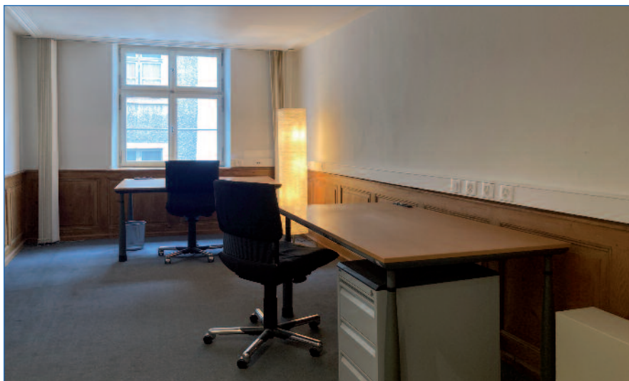
Arbeitsplätze (co working space) ab jetzt zu vermieten

Der Laden kann nahezu jederzeit besichtigt werden. Bei Interesse einfach melden unter: xxx